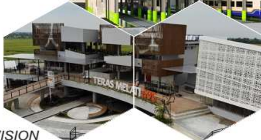
PLANNING & SUPERVISION DEVELOPMENT OF REST AREA