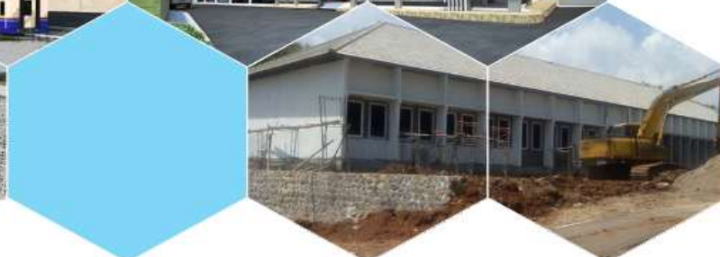
PLANNING & SUPERVISION DEVELOPMENT OF IMS TRAINING CENTER