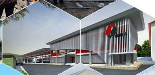
DESIGN AND SUPERVISION OF EXPEDITION OFFICE BUILDING AND QC INCOMING PT INKA