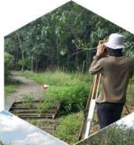
JOIN SURVEY AND TOPOGRAPHY