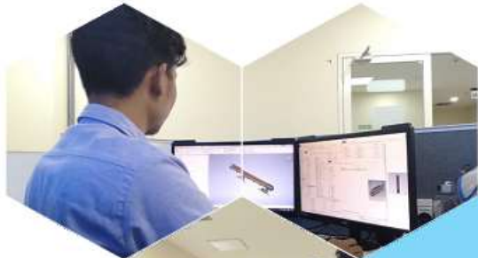
SUBCONTRACT 3D & 2D DRAWING